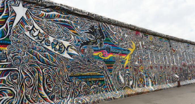
Schamil Gimajev, Wir sind ein Volk, 2018