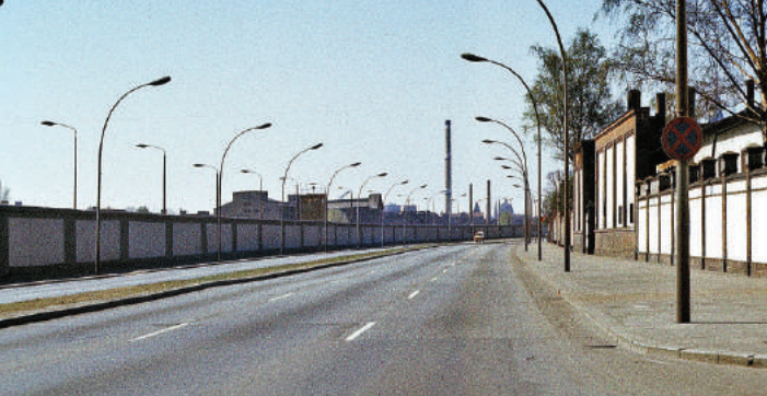
Mühlenstraße 1987.