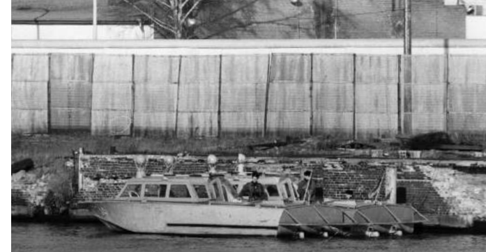
Patrouillenboot der Grenztruppen auf der Spree, 1980.