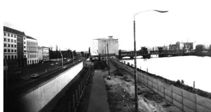
Grenzanlage an der Mühlenstraße, Blick nach Südosten, 1988.